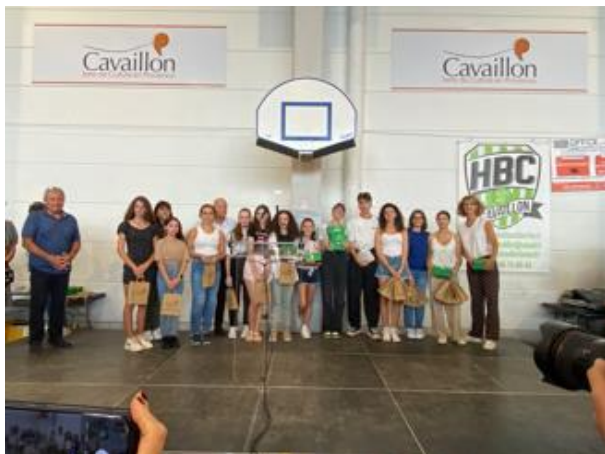
Forum des associations de la ville de Cavaillon 2022.

Soirée du Téléthon vendredi 2 Décembre 2022 à la Garance Cavaillon.